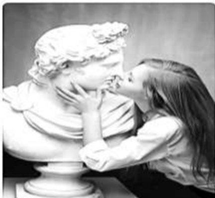
- AMOR CONCRETO