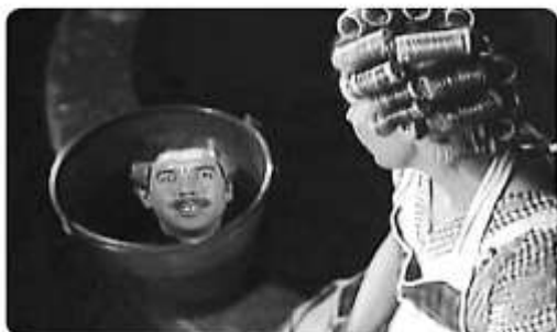
- AMOR LÍQUIDO

Os memes apresentados – o primeiro com uma moça humana beijando o busto de uma estátua de mármore, com o escrito “amor concreto”; e o outro com a famosa personagem do seriado mexicano Chaves , Dona Florinda, observando a imagem do seu amado Professor Girafales refletida na água em um balde, com a escrita “amor líquido” – exploram a linguagem em seus diferentes níveis de significação, utilizando referências culturais para ilustrar os conceitos de “amor concreto” e “amor líquido”.